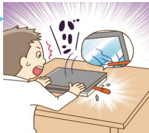
ペンを挟んだままパソコンを閉じてしまい画面が割れた