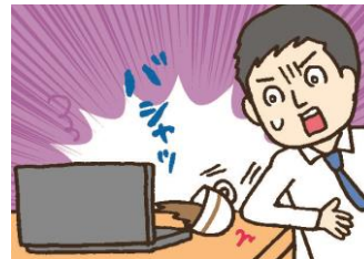
パソコンにコーヒーをこぼして基板損傷