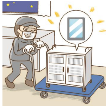
タブレットの保管庫ごと盗難された